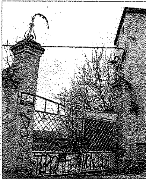
» À deux pas du centre, l'espace Beaunier compte douze hectares de friches à réhabiliter. Les acquisitions et démolitions vont se poursuivre en 2016.

Majorité comme opposition se sont rejointes sur la nécessité du traitement des friches industrielles, avant d'approuver à l'unanimité le lancement d'une nouvelle concertation publique.