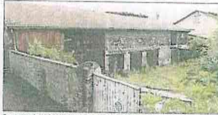
En contrebas de l'église, les anciens garages Jamond vont disparaître.

Impossible de ne pas avoir vu les panneaux qui annoncent la prochaine démolition de deux maisons au bout de la place Gambetta, juste derrière l'église. Achetées par la commune, elles seront d'abord désamiantées avant d'être détruites. L'objectif est d'ouvrir la place Gambetta sur le futur quartier Espace Beaunier. Un peu plus bas, les anciens garages Jamond, au 13, place Gambetta, en dessous du parking P12, seront également démolis. Ce programme de démolitions comportera un autre volet. Rue Paul-Bert, l'immeuble situé n°6 et