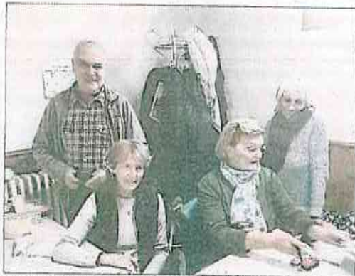
Une belle journée de solidarité pour les bénévoles de la section locale.