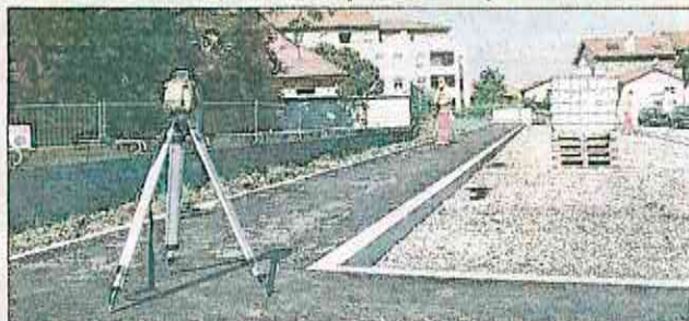
Ces travaux s'inscrivent dans le cadre du futur quartier Espace Beauvier.

Après un mois et demi d'arrêt, les travaux de requalification de la rue du Jeu-de-Boules, du carrefour de Curnieu à la rue de l'Industrie, viennent de reprendre. Ils s'inscrivent dans le cadre du futur quartier Espace Beauvier, la rue du Jeu-de-Boules étant amenée à devenir l'un des axes structurants de ce nouveau quartier. Les objectifs de ce vaste chantier sont aussi d'améliorer la circulation piétonne et la qualité de la voirie en enfouissant les réseaux électriques, de télécommunication et d'éclairage public. Ce sera également l'occasion de réhabiliter les réseaux d'assainissement, d'élargir la chaussée, de créer des trottoirs et enfin d'aménager de nouveaux parkings.