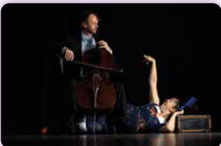
Jeune public - Cie Carnages "Sissi comme Bach" Mercredi 21 février - 15h et 16h30 Salle de spectacles - Médiathèque