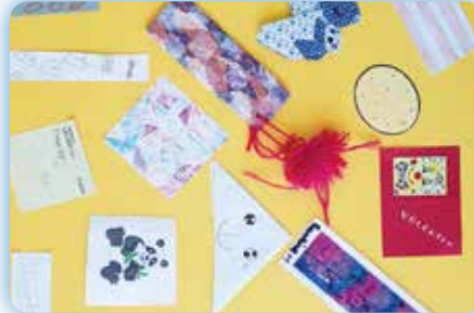
Expo insolite - "Marque ta page !" Du 19 décembre au 20 janvier Salle d'expositions - Médiathèque