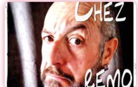
Concert rock "Chez Remo" Vendredi 9 février - 20h30 Salle de spectacles - Médiathèque