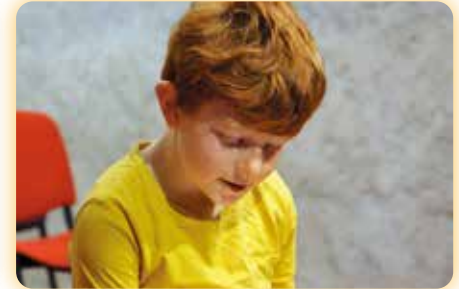
Lecture - Cie Les Pas Sages "Histoires à lire debout" Vendredi 19 janvier - 20h30 Salle de spectacles - Médiathèque