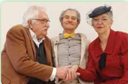
Théâtre - "La Cie Par nos lèvres joue Sacha Guitry" Vend. 26 et Sam. 27 janvier - 20h30 Salle de spectacles - Médiathèque