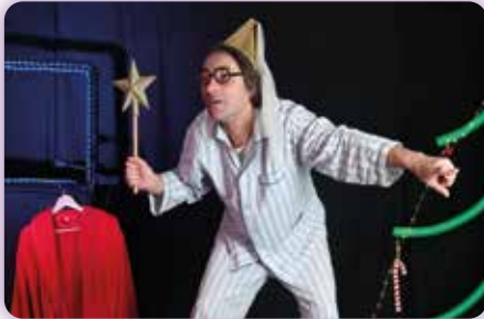
Jeune public - spectacle de Noël "Le Noël de Jean Pain d'Epice" Mercredi 13 décembre - 15h Salle de spectacles - Médiathèque