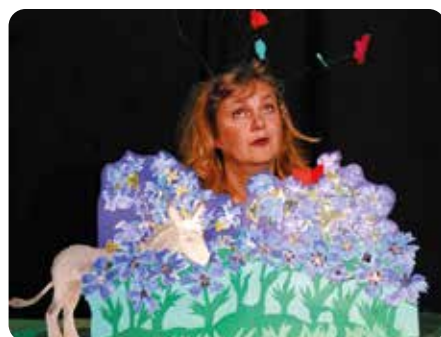
Jeune public - spectacle "Tâne, petit âne en chemin" de la Cie Carlota Tralala Mercredi 30 avril - 15h Salle de spectacles - Médiathèque