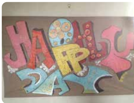
Exposition de tags de Martine Parinaud Du 10 au 28 juin Espace Crémonèse - Médiathèque