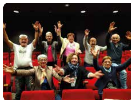
Théâtre - "Sacrées canailles" avec la Cie Croq'notes théâtre Vendredi 23 et samedi 24 mai - 20h30 Salle de spectacles - Médiathèque