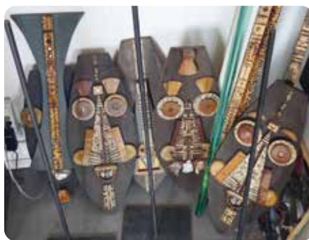
Exposition de sculpture et peinture de Pascal Vignon Du 1 er au 19 avril février Espace Crémonèse - Médiathèque