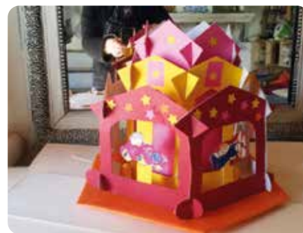
Jeune public - atelier créatif "pop-up" avec la Cie Carlota Tralala Mercredi 30 avril - 10h30 Espace Crémonèse - Médiathèque