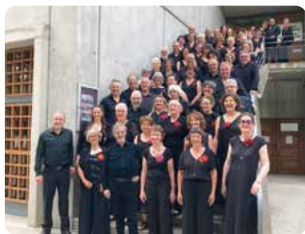
Anniversaire - Concerts Sinfonietta et Symphonia (voir p. 20) Le 29 mars - 15h - Médiathèque Le 29 mars - 18h - Eglise de Villars