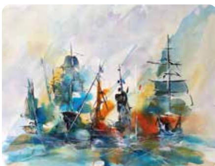
Exposition de peinture de Morgane Du 6 au 24 mai Espace Crémonèse - Médiathèque